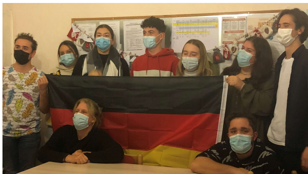
MOBILITE EN ALLEMAGNE