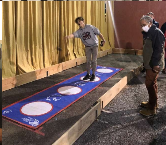
LA PETANQUE A NAUCELLE